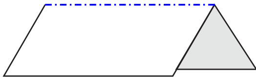
Mountain fold line / Pliage montagne